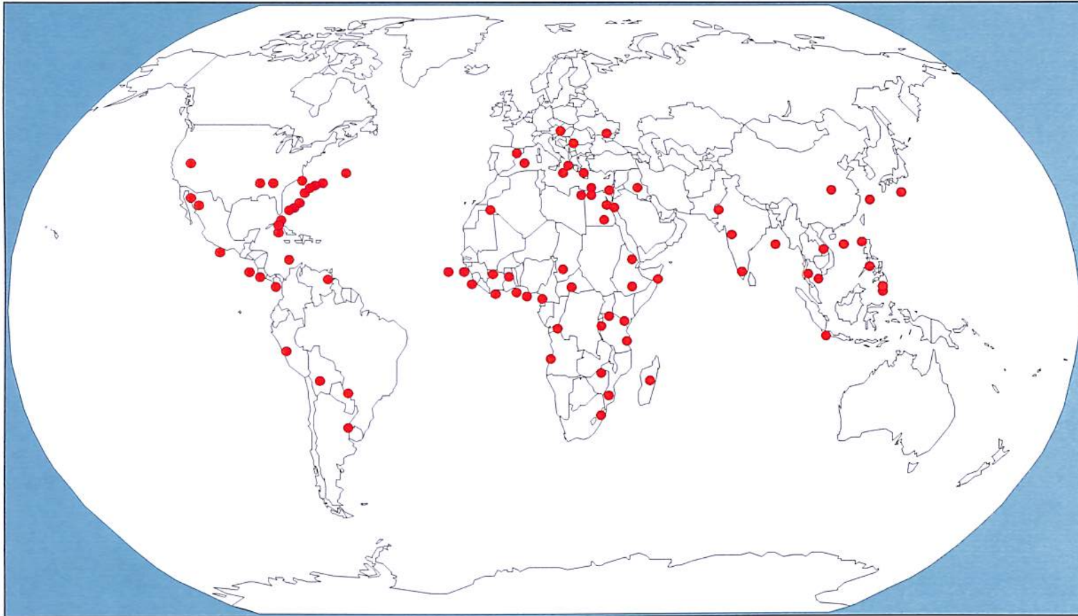
Implantation du Groupe Louis Berger à travers le monde