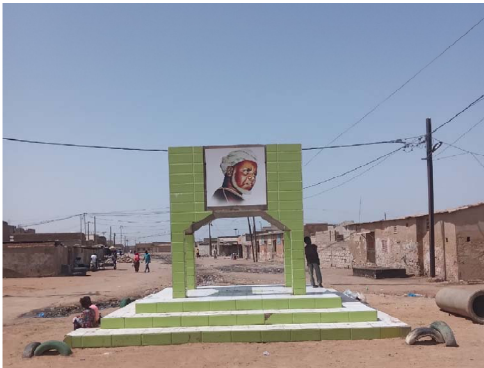
Illustration 2 : Monument de Cheikh Ibrahima Niass, au cœur de Ndangane (cliché Ousmane SÈNE 2024)