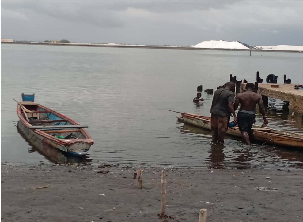
Illustration 1 : Le débarcadère du quartier Ndangane de Kaolack et les Salins du Sine- Saloum