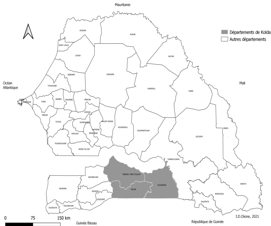
Figure n°1 : Situation géographique de la région de Kolda

Avec une économie dominée par l’agriculture et l’élevage, la région n’englobe que 4,8% de la population active du pays et présente le deuxième taux de chômage déclaré le plus élevé du Sénégal (38,8%), loin du taux national qui est de 25,7% (ANSD, 2017). Selon le rapport sur les cartes de la pauvreté au Sénégal (Banque mondiale et ANSD, 2016), Kolda est la région la plus pauvre du pays avec un taux de pauvreté estimé à 77,5 %. Aussi, 38 des 40 communes que compte la région, ont des taux de pauvreté de 60 % ou plus, 14 d’entre elles affichent des taux de 80 % ou plus. Cette forte prévalence de la pauvreté peut justifier le fait que la région occupe la première place au classement des bénéficiaires du PNBSF avec 29 760 bénéficiaires en 2020, selon les estimations du ministère du développement communautaire, de l’équité sociale et territoriale. Ces bénéficiaires sont répartis dans les trois départements de la région : Kolda : 10673 ; Médina Yoro Foulah : 6420, Vélingara : 12667.