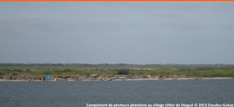
Campement de pêcheurs ghanéens au village côtier de Diogué

Doudou Dièye Gueye Université Assane Seck de Ziguinchor