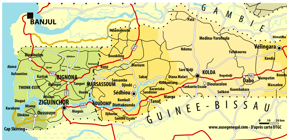
Figure 3: Carte de la Casamance naturelle