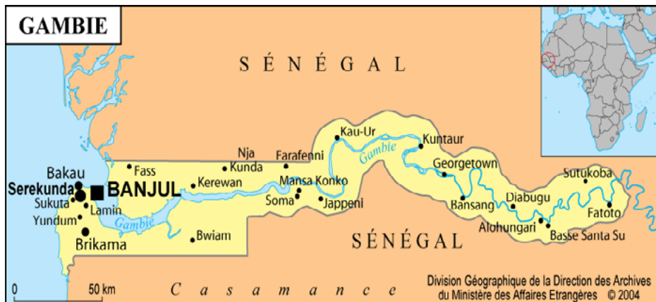
Figure 2 : Carte de la Gambie