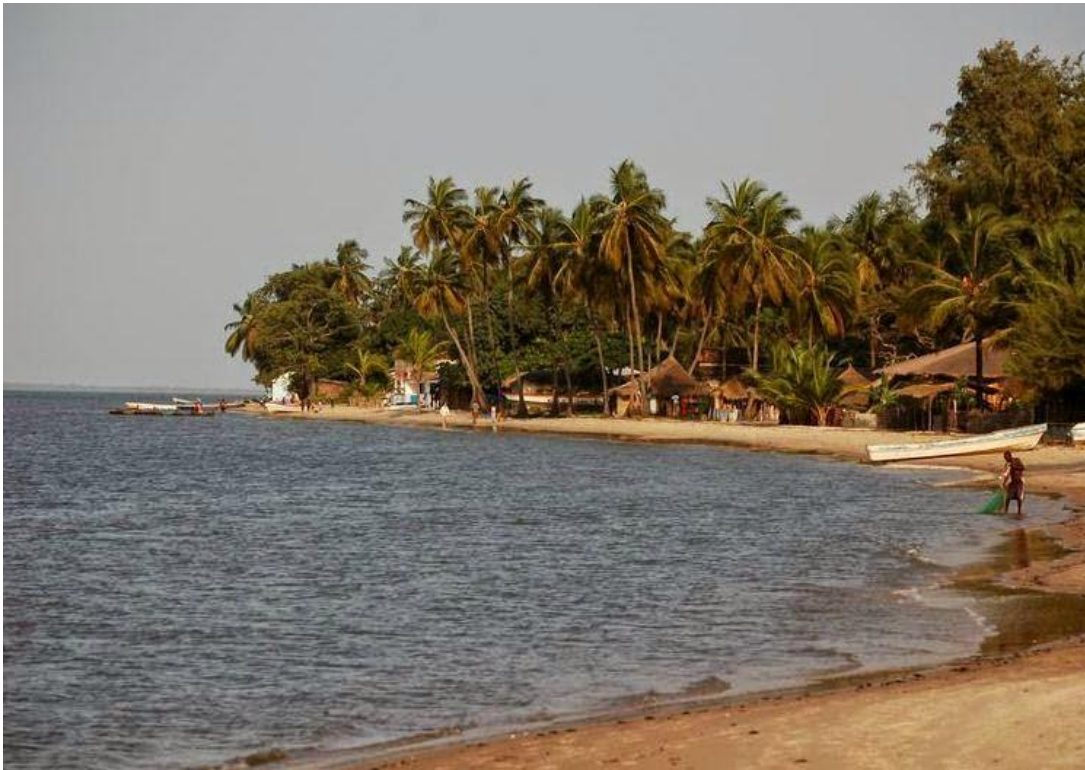
Photo1:l'île de Carabane