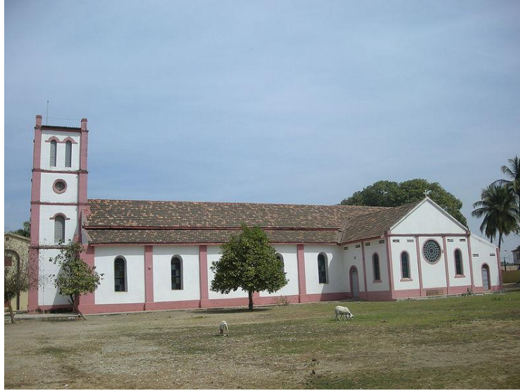
Photo2: Cathédrale St Antoine de Padoue 24

Nous avons également les Maisons à impluvium du Royaume de Bandial dans le département de Ziguinchor et les cases à étages de Mlomp dans le département de Bignona. Du point de vue de leur architecture originale ainsi que l'illustration du savoir-faire de population qui les a construites, ces œuvres peuvent être à la fois classées dans le registre du patrimoine historique au niveau des monuments ainsi que dans le registre du patrimoine artistique.