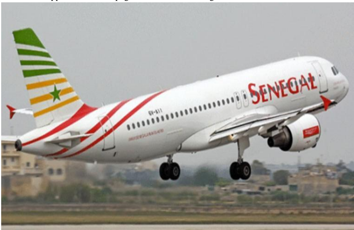
Photo7 : un appareil de la compagnie aérienne Air Sénégal SA 45