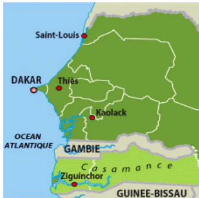
Carte 1 : la position géographique de la Casamance naturelle 10

Grâce à cette position géographique privilégiée, certains écrits font l'éloge de la Casamance en ces termes :