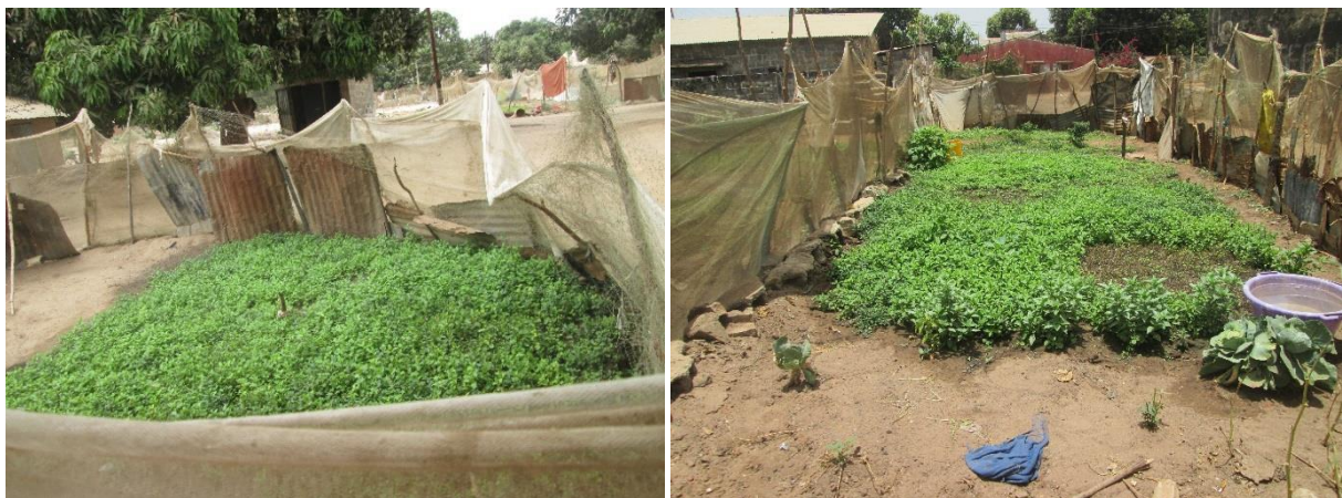
Figure 4 : Protection des micro-exploitations des menthes contre la divagation du bétail