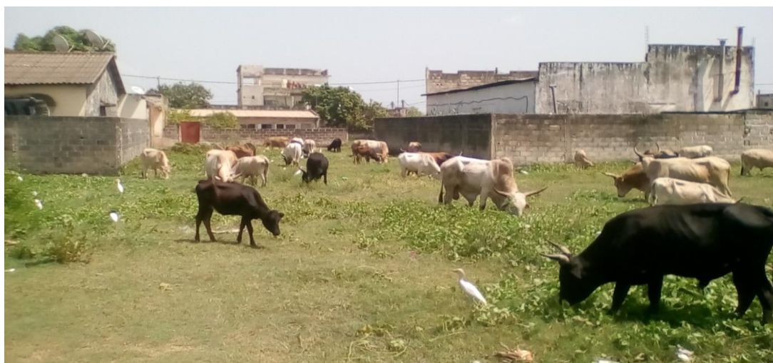
Figure 5 : Pâturage des bovins dans les parcelles loties vacantes du quartier de Goumel