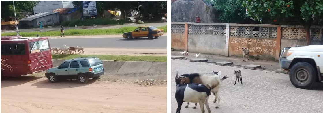
Figure 6 : Divagation du bétail dans le réseau routier de Ziguinchor

La dualité conflictuelle entre l'élevage et le trafic urbain, résulte aussi de l'effet de la divagation des animaux dans la ville ( Figure 6 ).