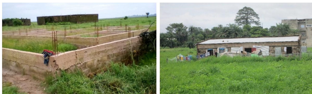
Figure 3 : Prolifération des habitats spontanés dans la vallée agricole de Diéfaye